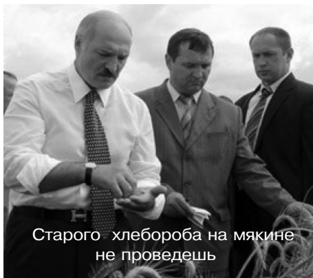
Старого хлебороба на мякине не проведешь

Александр Лукашенко ожидаемо выиграл президентские выборы в Беларуси в четвертый раз подряд. Что бы ни писала о нем прогрессивная общественность, нужно признать, что образованные и трудолюбивые белорусы, все же доверяют своему лидеру, которого они могли бы запросто прокатить на выборах. Бывший директор совхоза и замполит роты в свои 56 лет может уже взирать на коллег-руководителей с высоты не только своего физического роста (его рост 190 см.) но и политического роста (во главе республики он уже 16 лет). Крепкая народная закваска позволяет ему стойко переносить регулярную и не всегда обоснованную критику и с запада и с востока. Находясь в центре Европы, в очень сложное время, белорусский президент, совершил немало подвигов, сохранив экономику страны, обеспечив стабильность и прогресс. Были у него и ошибки, но он всегда твердо держал властный штурвал и оставался на страже интересов большинства своего народа. Поэтому он снова президент.